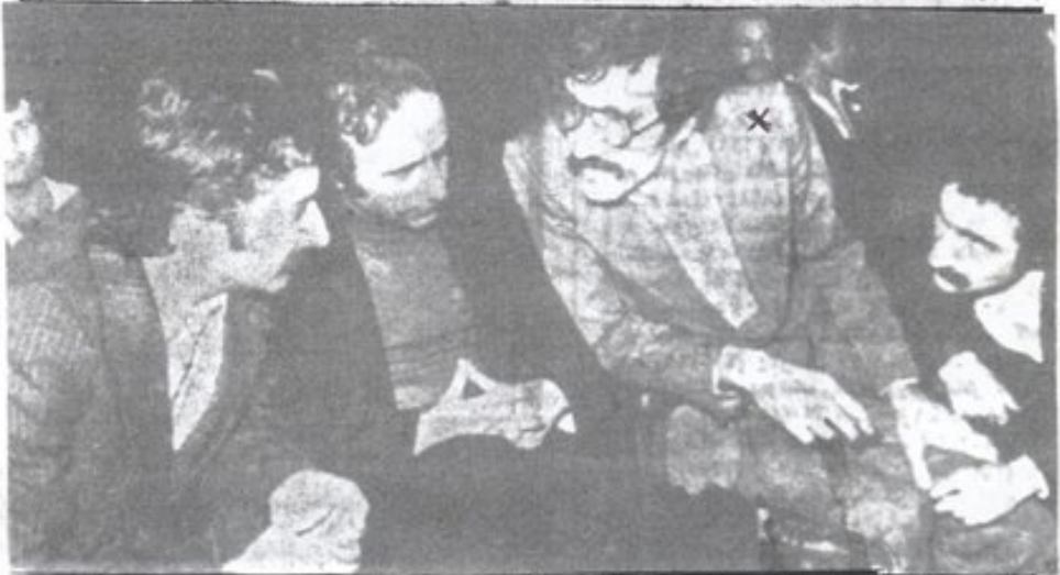
متهمان پس از پایان آخرین دفاع بانتظار صدور رای دادگاهها یکدیگر گفتگو می کنند.

همینگونه او نیز افتال شده است. وی سپس و صحبت نمود را پس از مراجعت به ایران مورد بحث قرار داد و یادآور شد که در داخل کشور سیسه بی اساس بودن تبلیغات بیگانگان برآمده و از اولین روزها داشت با مسافرت کابل پلنرا چه مسئول همکاری کرده و اینک برمسخر دادگاه نیز ماهیت فکری و دست آوردهای تازه خود را از سلسله پیرامون اوضاع ایران به عرض می رساند . به آن امید که با گذرش به ندامت و صدافت او به وی امکان خدمتگاری درست و درجهت مسائل ملی و میهنی داده شود.