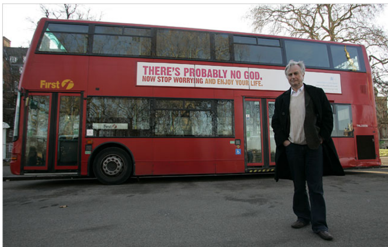
Sir Richard Dawkins.